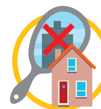
referentiewoningen lijken niet op uw woning