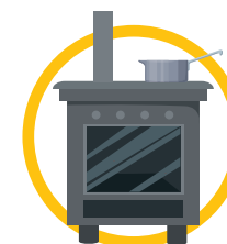
verouderd sanitair en keuken