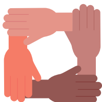
Promotie en samenwerking

Voor de uitwerking van de visie Recreatie en Toerisme hebben we gekozen voor vier thema's, namelijk: