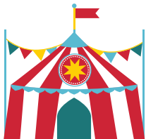
Activiteiten en evenementen

Deze doelgroepen en thema's zijn besproken met de klankbordgroep en tijdens de themabijeenkomsten met toeristische organisaties. Hieronder vatten we de belangrijkste conclusies per thema samen. In de bijlagen staat een uitgebreider verslag van de bijeenkomsten.