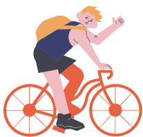
Routes (onder andere wandel- en fietsroutes)